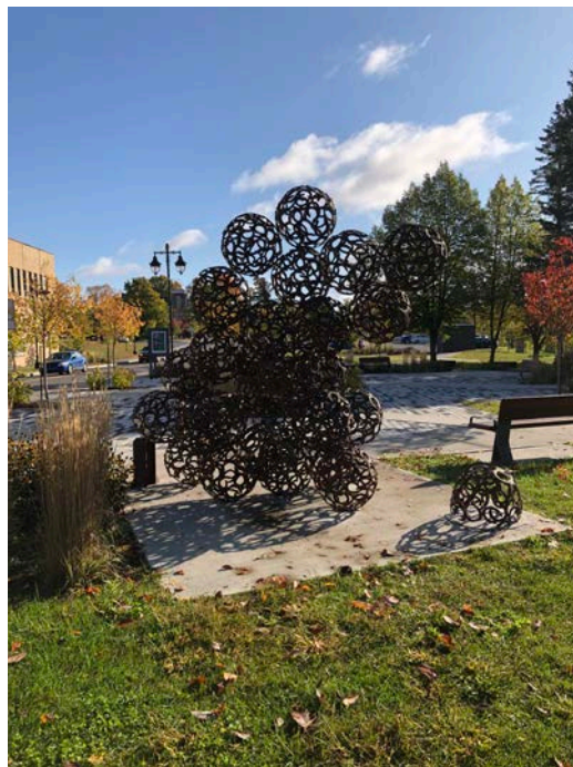
« Entrelacs », LaGaan

Le mandat consiste à concevoir et réaliser une œuvre d'art urbaine en harmonie avec la superficie et l'environnement du site qui l'accueille tout en respectant les directives du projet ci-dessous décrit.