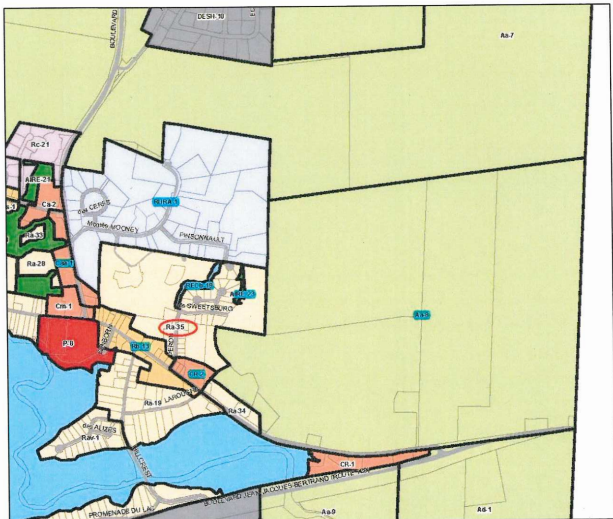
(Secteur rue des Hauts-Prés / zone Ra-35)

Que la zone concernée par la disposition est constituée de la zone Ra-35 et des zones contiguës RURA-1, RECb-19, AIRE-23, Aa-8, Cr-2, Rb-13 et Caa-1 qui sont illustrées au croquis suivant :